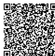
文部科学省告示第 51 号