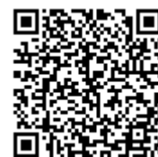
GIGA スクール 構想の実現

このために打ち出された対策の一つとして、国全体の学習保障に必要な人的・物的支援の一つとして「ICT 端末を活用した家庭学習のための環境整備」が掲げられ、ICT の早急な整備と積極的な活用が示されたことであった。